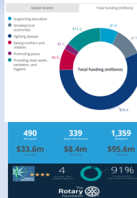
Number of global grants by areas of focus

The Rotary Foundation helps Rotarians to advance world understanding, goodwill, and peace by improving health, providing quality education, improving the environment, and alleviating poverty."